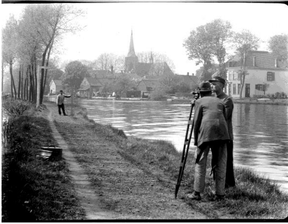
Ambtenaren van Provinciale Waterstaat verrichtten omstreeks 1930 metingen op het jaagpad langs de Oude Rijn (ter hoogte van Koudekerk).

In de jaren vijftig groeide de aandacht voor cultureel en maatschappelijk werk. De provincie werd actief op het gebied van welzijn, recreatie, 'sociale planning' en gezondheidszorg. Inmiddels zijn de meeste van die taken weer bij de provincie weggehaald.