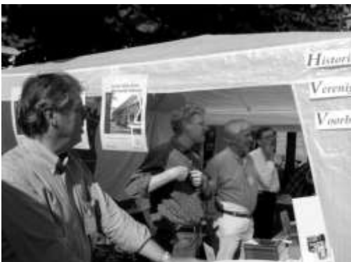
Enthousiasme tijdens Open Monumentendag