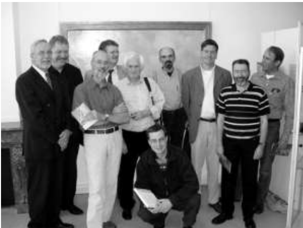
auteurs en medewerkers Boerderijenboek