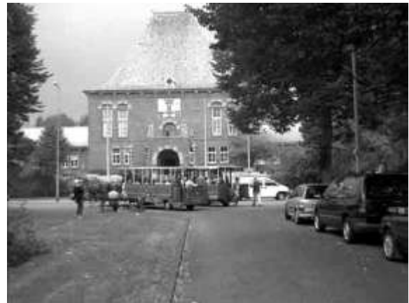
Met de paardentram door Leidschendam, eindigend bij het stadhuis, alwaar een drankje en een hapje werd geserveerd.