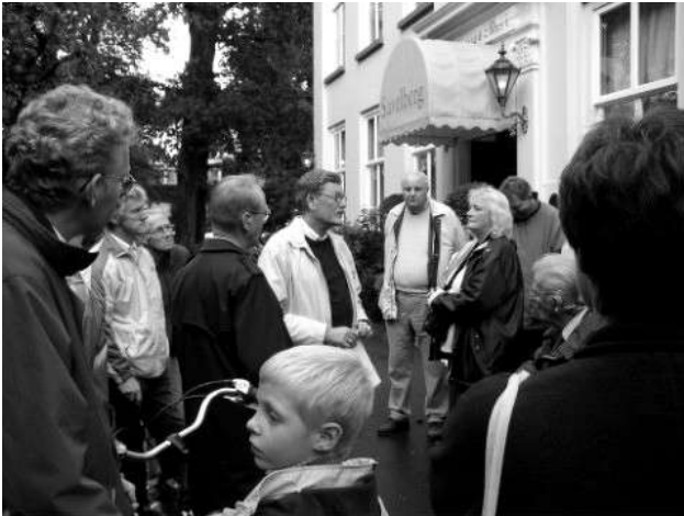
Een avondwandeling door historisch Voorburg

Enkele impressies uit onze jubileumweek: