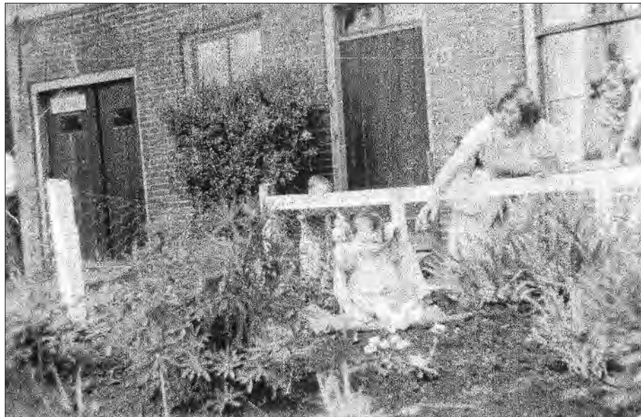
Onder: De toegang tot de tijdelijke bibliotheek 'St. Laurentius' in een huis van het rooms-katholieke Armbestuur in de Dr. Van Noortstraat 65, ca. 1953.

Vanaf 1967 hadden de bibliotheekorganisaties de intentie uitgesproken om op sommige terreinen tot samenwerking over te gaan. Dit leidde in 1969 tot ondertekening van een 'Overeenkomst van Samenwerking' door beide besturen en de instelling van een Coördinatiecommissie, een overlegorgaan, gevormd uit leden van de besturen. De coördinatiecommissie zou het beheer voeren over het filiaal Prinsenhof en de bibliotheek van Stompwijk.