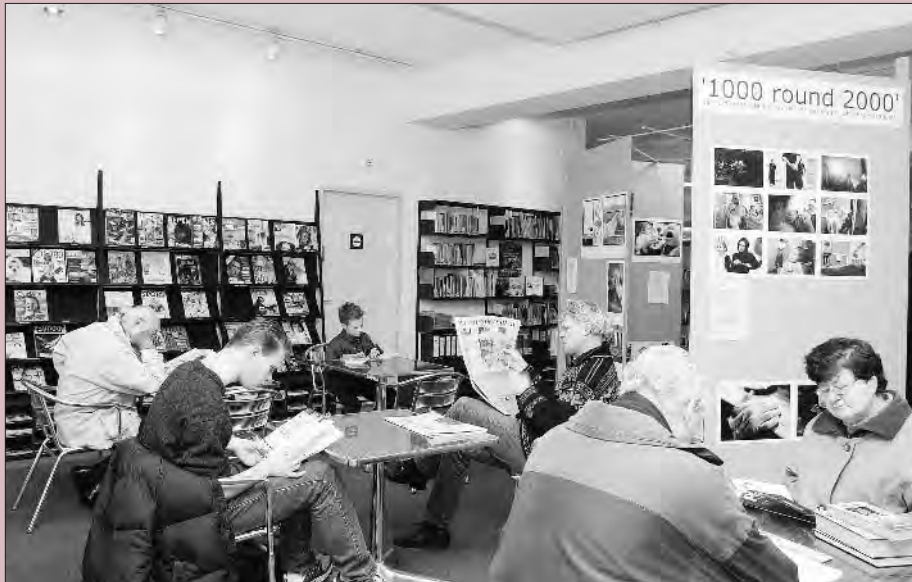
Foto Pevry Press Voorburg, 2004. Collectie Bibliotheek Leidschendam-Voorburg

Vanaf 2003 Bibliotheek Leidschendam-Voorburg, locatie Voorburg