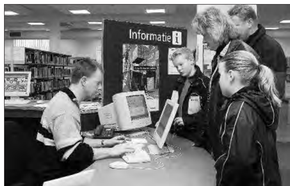
Foto's Pevry Press Voorburg, 2004. Collectie Bibliotheek Leidschendam-Voorburg

In 1990 gaat de bibliotheek over van een semi-handmatig systeem op een volledige automatisering van de catalogus en uitleenadministratie. Twee jaar later wordt een speciale afdeling met informatie over Voorburg geopend. In deze Voorburgcollectie is lokale informatie in allerlei vormen bijeengebracht,