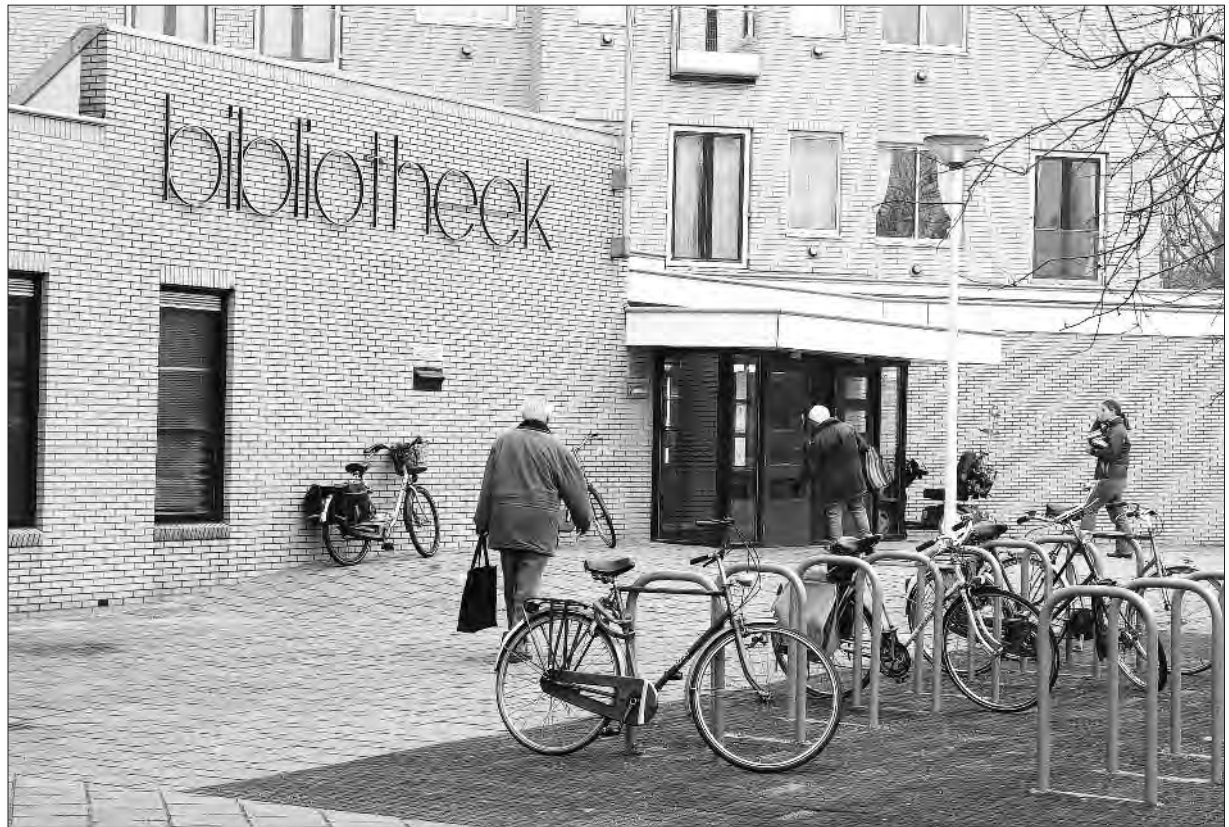
Foto Pevry Press Voorburg, 2004. Collectie Bibliotheek Leidschendam-Voorburg

Wegens de voorziene fusie van de gemeenten Leidschendam en Voorburg werden vanaf 2001 besprekingen tussen de besturen van de beide bibliotheken gevoerd met het doel te komen tot een fusie van de beide bibliotheken. Deze zouden leiden tot één openbare bibliotheek voor Leidschendam-Voorburg.