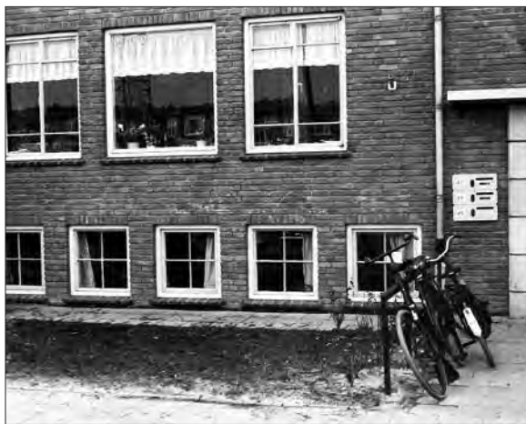
Rechts: Het filiaal in de Jacob van Lennepstraat 45, 1956.