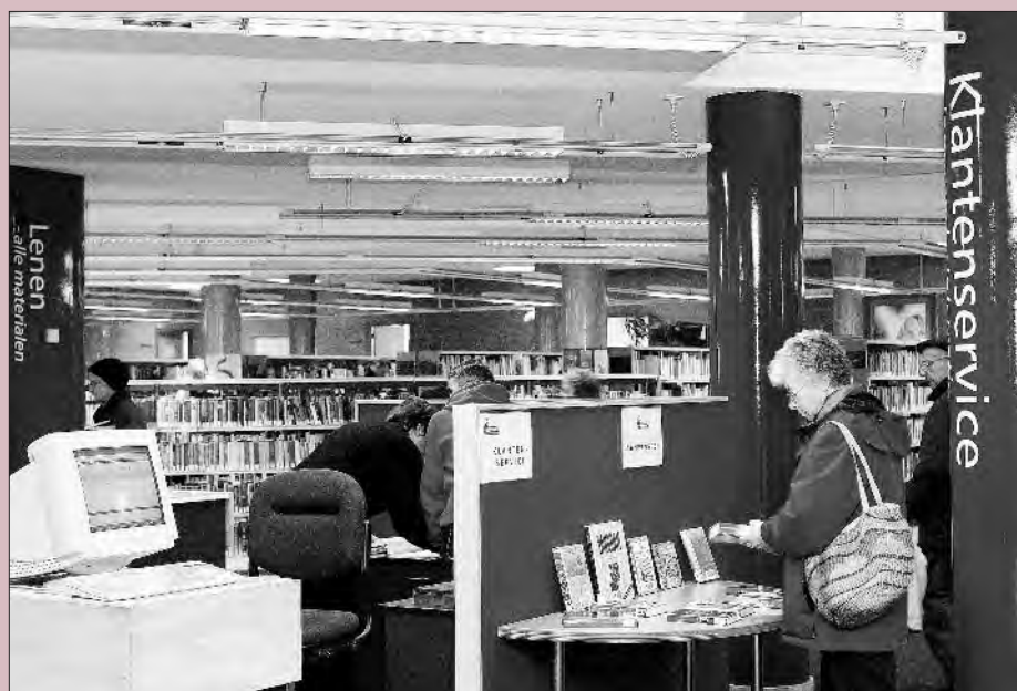
Foto Pevry Press Voorburg, 2004. Collectie Bibliotheek Leidschendam-Voorburg