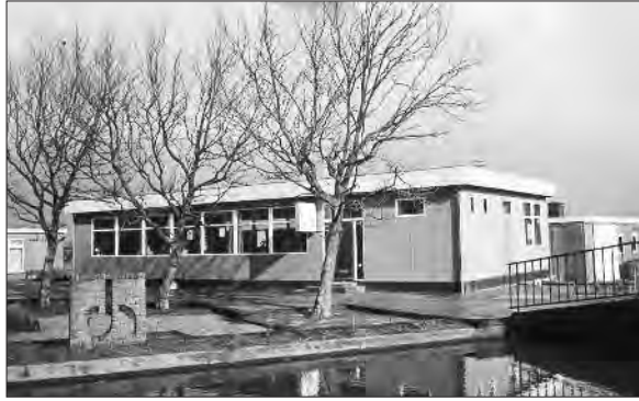
Rechts: Via de brug over de Stompwijkse Vaart naar de nieuwe bibliotheek van Stompwijk.