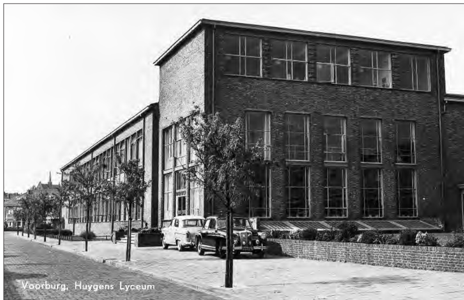
Voorburg, Huygens Lyceum