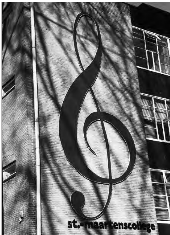
School, als sleutel tot muziekgenieten.