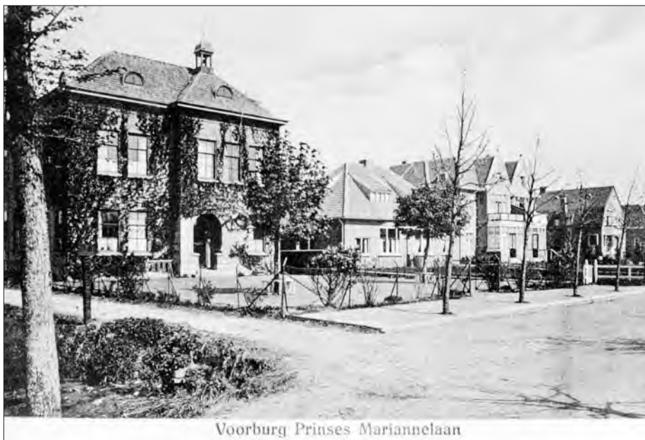
Voorburg Prinses Mariannelaan