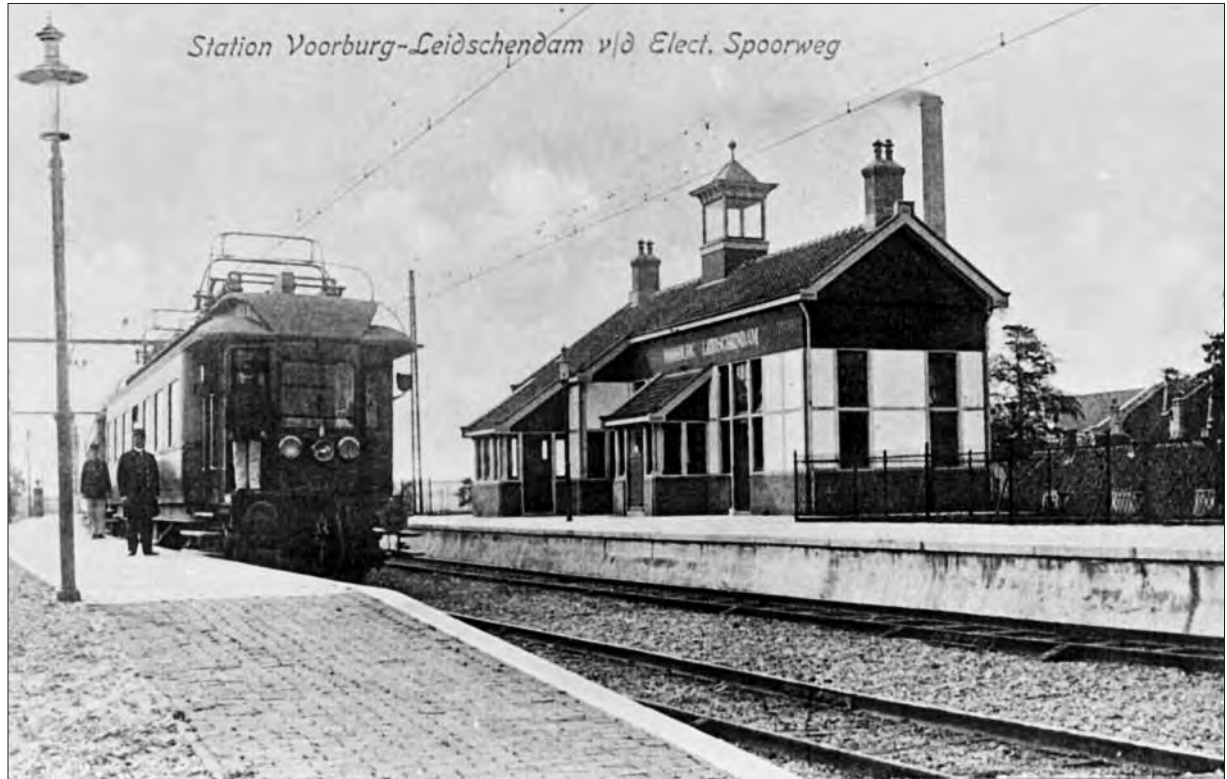
Station Leidschendam-Voorburg van de spoorbaan Rotterdam-Den Haag via Pijnacker; blik in de richting van Leidschendam, 1909.

Haag ruim fl. 60.000 betaald. Over de hoogte van deze bedragen werd daarna enige malen onderhandeld. Vergelijkbare regelingen trof de gemeente Voorburg met de gemeenten Delft en Leiden. De bedragen die aan die gemeen-