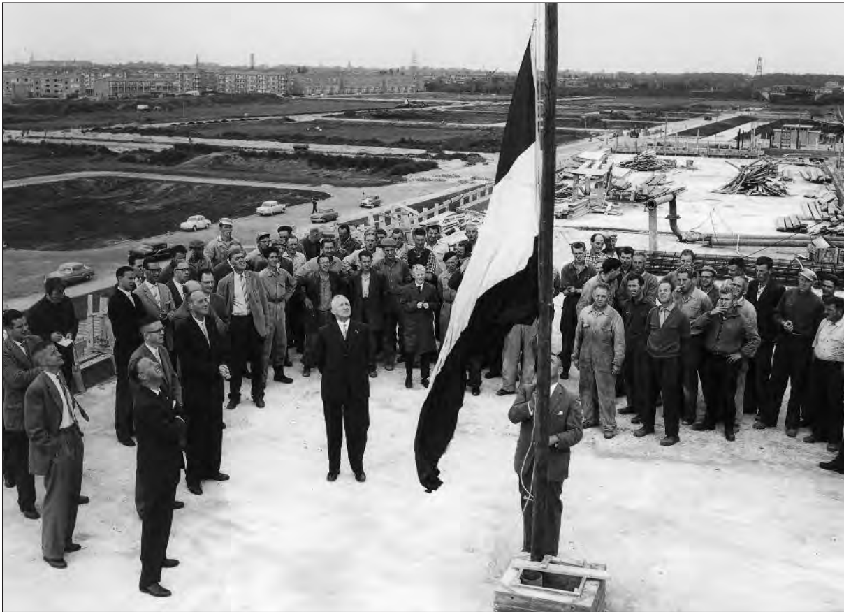
September 1959: het hoogste punt van het Christelijk Lyceum is bereikt. Rondom is het nog een kale vlakte.

Op 1 september 1946 startte het eerste lyceum in Voorburg. Dat was het Huygenslyceum. De bedoeling was een oecumenische middelbare school te beginnen voor orthodoxe en vrijzinnige protestantse leerlingen. Tevens zou de school belangstelling kunnen genieten van anderen, die een christelijke geest in de school voor hun kinderen konden waarderen. De school ontwikkelde zich in een richting waar vele hervormden en gereformeerden zich niet mee konden verenigen. Vandaar dat op 15 april 1955 de oprichting plaats vond van de Vereniging voor Christelijk Middelbaar en Voorbereidend Hoger Onderwijs voor Voorburg en omstreken. De statuten van de vereniging werden goedgekeurd bij Koninklijk Besluit van 4 oktober 1955, no. 56.