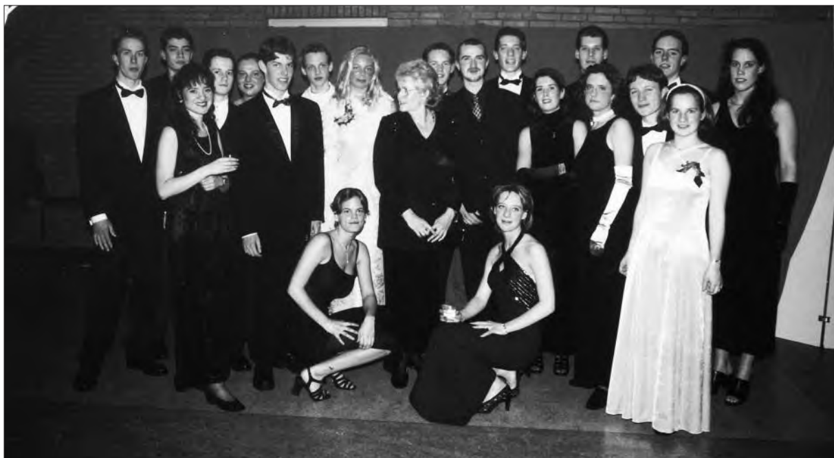
Het galabal van eindexamensklassers, 1998.

Om de toenemende belasting van de docenten tegen te gaan werd op het Maartens geprobeerd ouders van brugklassers bij de les te betrekken met een project Studie, Betrokkenheid en Methodiek. Desondanks bleek meer begeleiding wenselijk. In het schooljaar 1988-1989 werd de huiswerk cursus van de brugklassen uitgebreid naar alle tweede klassen. De leerlingbege-