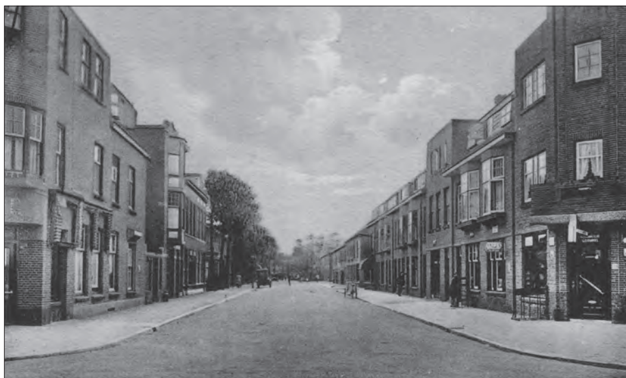
Een oude Ansichtkaart van de Heeswijkstraat.

In 1962 hield hij het voor gezien in het zuivelvak en zocht een kantoorbaan. Hij solliciteerde en werd aangenomen bij Verzekeringsmaatschappij De Nationale Nederlanden in de Groenhovenstraat in Den Haag. In het begin moest hij wennen aan het binnenzitten en wist hij zich bijna geen raad met de vele vrije tijd, vergeleken met zijn eerdere baan. Omdat de bedrijfswagen was verkocht, huurde hij de eerste tijd nog een auto om met vrouw en kinderen erop uit te gaan. In 1984 ging hij met de VUT.