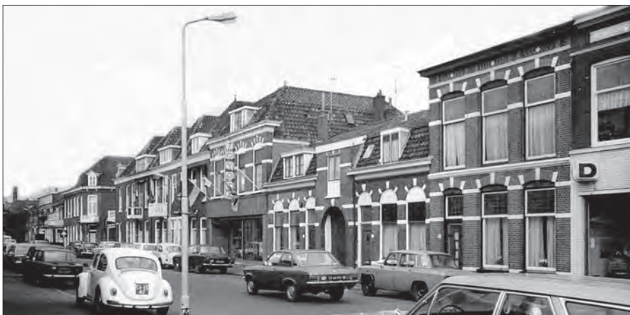
De showroom in de Heeswijkstraat, begin jaren zeventig.

Terugkijkend op zijn succesvol werkzaam leven: 'Ik moet zeggen dat het mij is overkomen, ik heb de tijd mee gehad. Aan de andere kant ging ik creatief om met de kansen die ik kreeg. Je zou kunnen zeggen dat ik in de gouden eeuw heb geleefd. Vrienden en relaties zijn voor mij altijd heel belangrijk geweest. Veel vrienden ken ik al vanaf de schooltijd. De meesten gingen na de middelbare school studeren, ik was een van de eersten die in een auto reed! Ik bezit nog vijf oude auto's, waaraan ik af en toe knutsel. Verder beheer ik mijn onroerend goed en houd mijn administratie bij. Mijn grote hobby is de watersport, waaraan ik ondanks mijn drukke werkzame leven veel plezier beleefde. En nog steeds zit ik graag op of aan het water.'