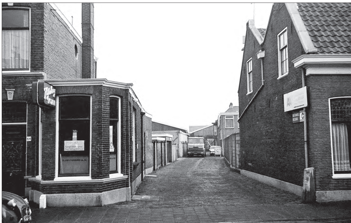
De uitbouw van Krijtenburg, Westende 64 met de gang ernaast naar de Vliet, 1972.