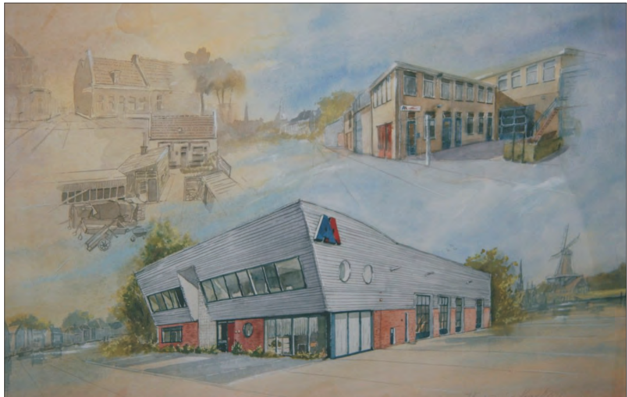
Artistieke impressie van de inrit en oude schuur (linksboven, Westeinde), het vernieuwde kantoor (rechtsboven, Westeinde) en het pand aan het Schietlood.